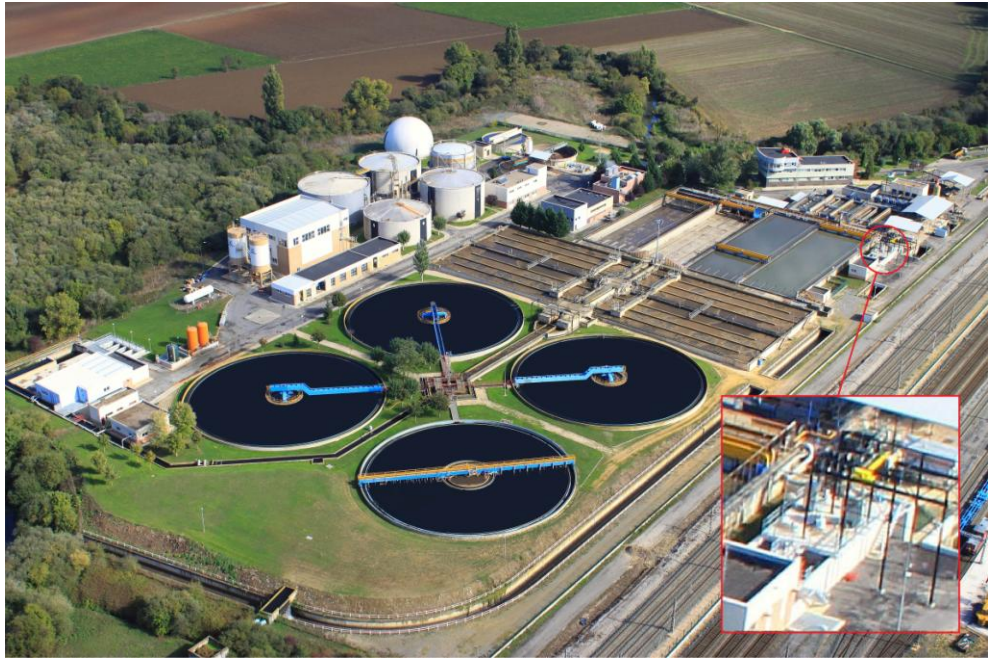
Figura 3. Fotografía aérea del sistema Actiflo® Turbo para tormentas en la EDAR de Crispijana